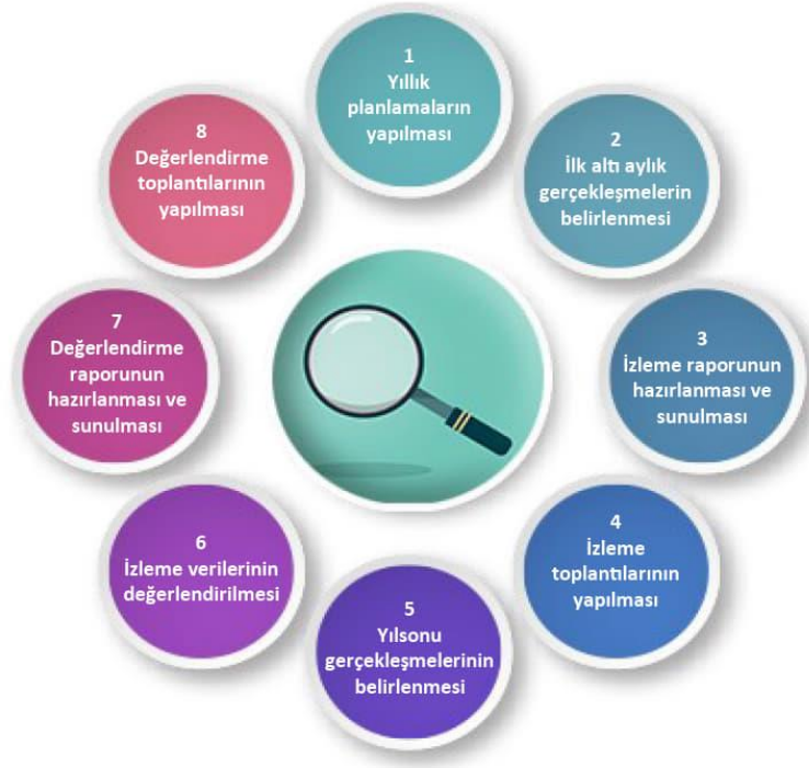
Şekil-4 İzleme ve Değerlendirme Süreci

İzleme ve değerlendirme sürecinin işleyişi ana hatları ile yukarıdaki şekilde özetlenmiştir.